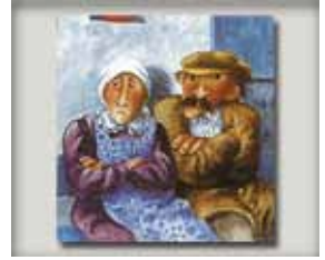
Να σε αγαπούν