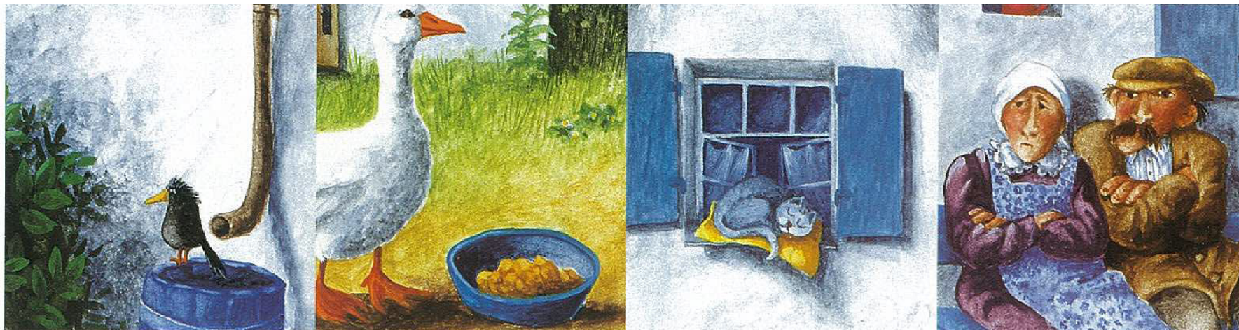
Συναίσθημα: Εκφράσεις προσώπου και στάσεις του σώματος