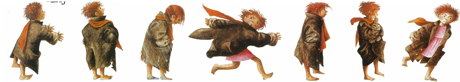
Άσκηση: Βασικές ανάγκες