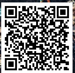
Photo: Riomaggiore, Italy