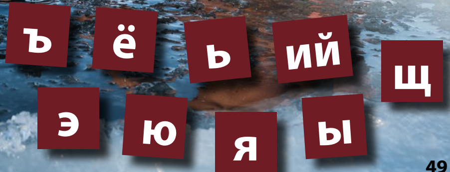
Photo: Swimming in an ice hole, Russia